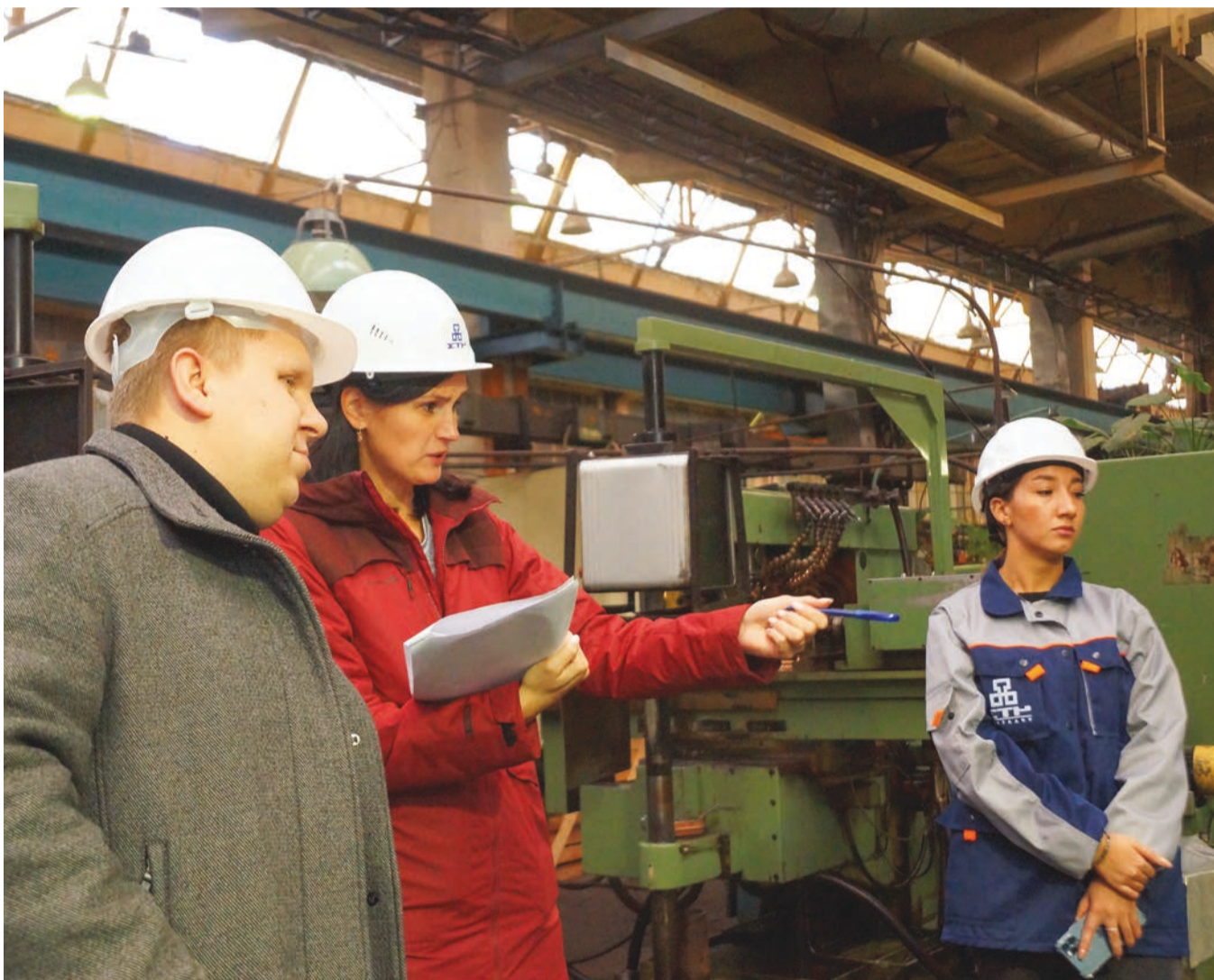
Четвертый этап конкурса проходил в цехе по изготовлению инструмента ООО «Челябинский тракторный завод – УРАЛТРАК».

Команда Ашинского метзавода заняла третье место в смотре-конкурсе Федерации профсоюзов Челябинской области «Лучшее социальное партнерство в сфере охраны труда» среди организаций внебюджетной сферы.