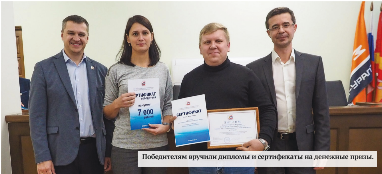
Победителям вручили дипломы и сертификаты на денежные призы.