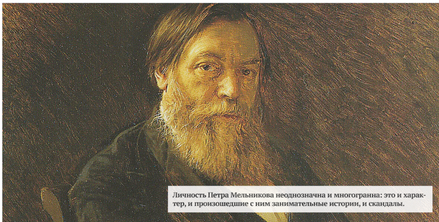
Личность Петра Мельникова неоднозначна и многогранна: это и характер, и произошедшие с ним занимательные истории, и скандалы.

Произведения писателя Мельникова-Печерского переиздавались множество раз и всегда находили своего читателя-ценителя. К таким востребованным на протяжении ста пятидесяти лет романам относится диалогия «В лесах» и «На горах».