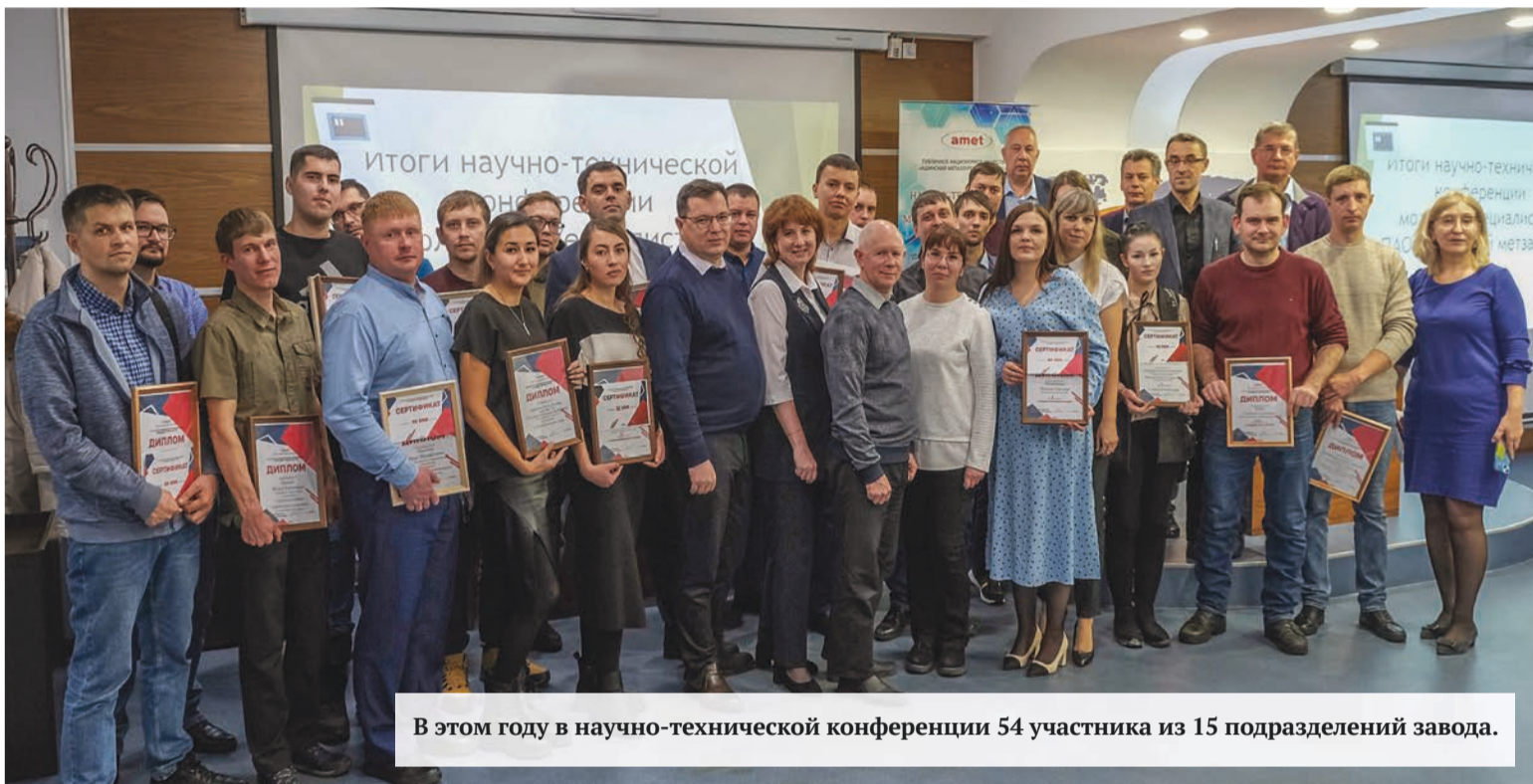
В этом году в научно-технической конференции 54 участника из 15 подразделений завода.

23 ноября в конференц-зале заводоуправления подвели итоги XXI научно-технической конференции молодых работников ПАО «Ашинский метзавод».