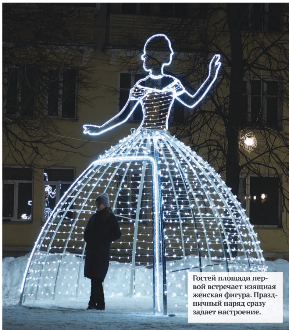
Гостей площади первой встречает изящная женская фигура. Праздничный наряд сразу задает настроение.