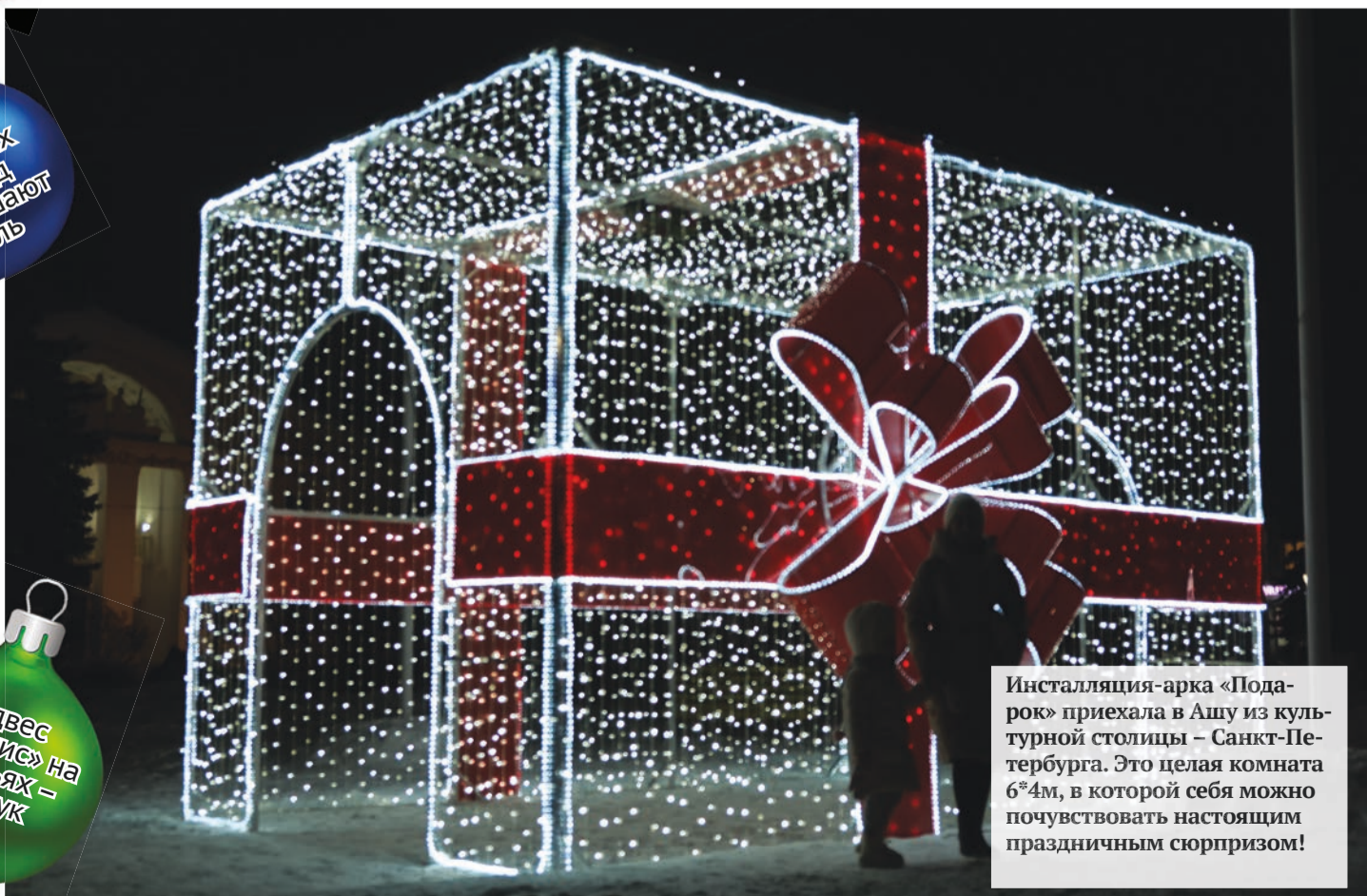
Инсталляция-арка «Подарок» приехала в Ашу из культурной столицы – Санкт-Петербурга. Это целая комната 6*4м, в которой себя можно почувствовать настоящим праздничным сюрпризом!