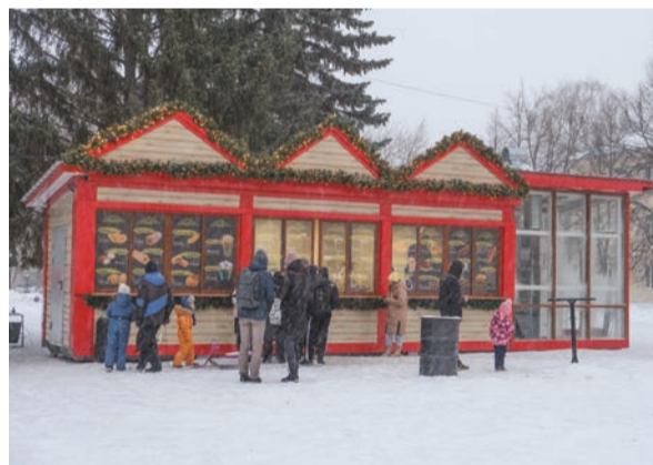
Ашинцы уже оценили работу торгового павильона с продукцией «Соцкомплекса». Рядом поставили столики для удобного приема горячей еды. Меню и цены – на фасаде.